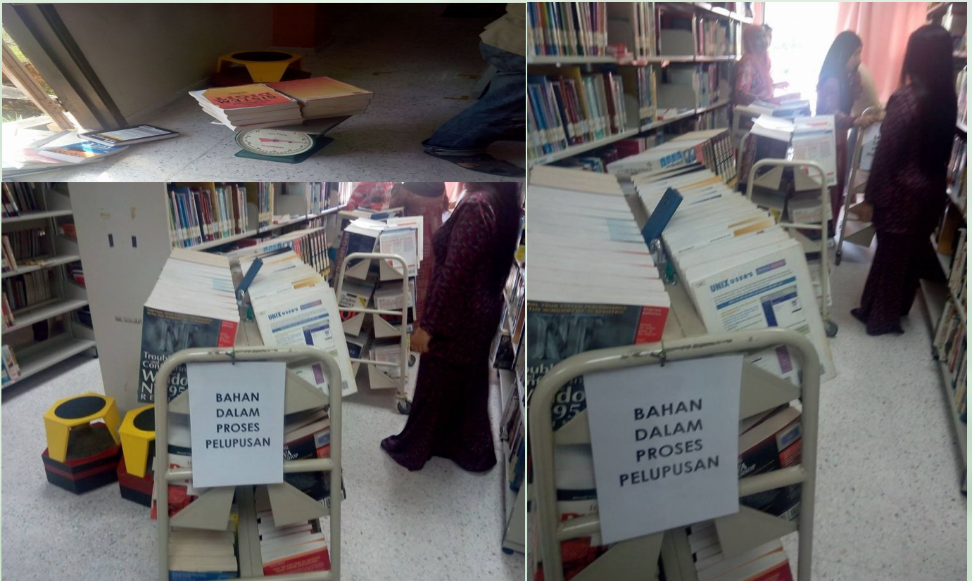
PROSES PELUPUSAN BUKU VERSI LAPUK FASA KEDUA