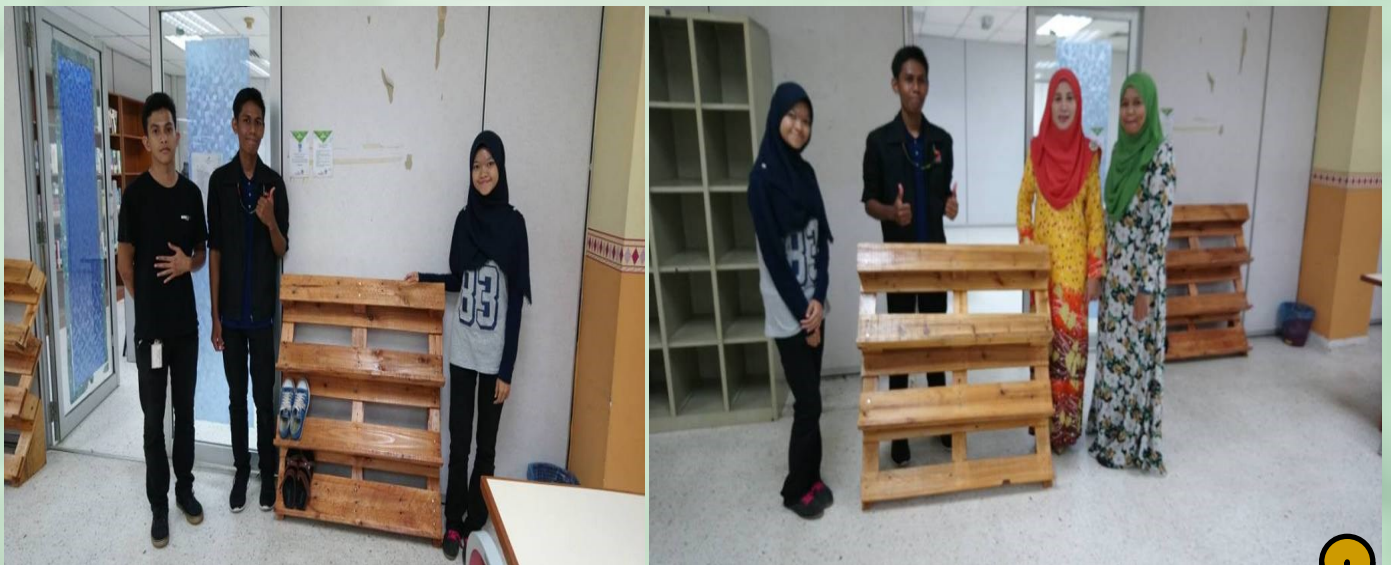
PENYERAHAN RAK KASUT KEPADA UNIT PERPUSTAKAAN PROJEK AKHIR OLEH PELAJAR SEMESTER 5 JURUSAN DIPLOMA TEKNOLOGI BERASASKAN (KAYU) PSA