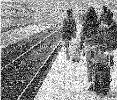
PILIH beg yang sesuai agar anda mudah mengendalikan barang ketika menaiki kereta api.