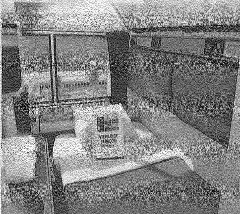
KABIN tidur dalam kereta api yang memberikan keselesaan kepada penumpang.